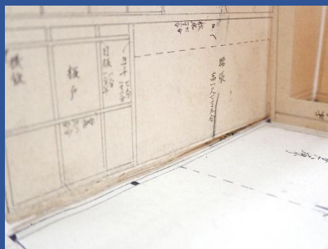
修理前(起こし絵図 糊の外れ)