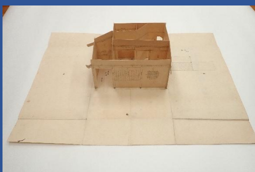
修理前(起こし絵図 全景)