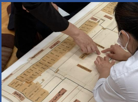
修理中(貼絵図 修理箇所を検討)