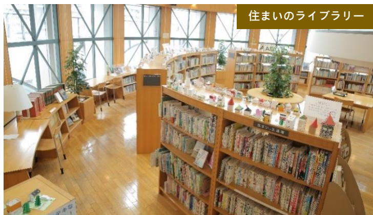
住まいのライブラリー