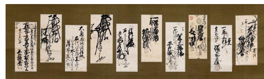
「旧各藩米券集」個人蔵 (大阪くらしの今昔館 特別展にて展示予定)

パネルの紹介 講演終了後、神戸大学附属中等教育学校の学生(高校2年生)の皆さんに、4階で開催中の関連パネル展についてご紹介いただきます。(15時30分~約30分間・3階ホール)