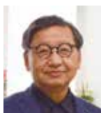
コーディネーター 大阪市ハウジングデザイン賞 選考有識者会議座長

1980年大阪府生まれ。2008年和歌山大学大学院システム工学研究科修士課程修了(本多・平田建築設計研究室)。2012年Office for Environment Architectureを設立。2014年から大阪長屋のリノベーションシリーズ「ヨシナガヤ」を継続して行う。現在27軒完成、目標は100軒。林寺2丁目長屋で第34回大阪市ハウジングデザイン賞特別賞受賞。現在、大阪公立大学大学院・摂南大学非常勤講師。