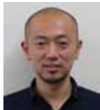
基調講演 パネリスト