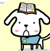
住まいのライブラリー 案内犬 すまいまる

締 切 日：令和5年 3月12日(日)必着 締め切り後、 参加証 をお送りします。