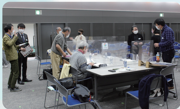
~令和3年度交流会より~

お問い合わせ： 大阪市立住まい情報センター 〒530-0041 大阪市北区天神橋 6-4-20 TEL.06-6242-1160