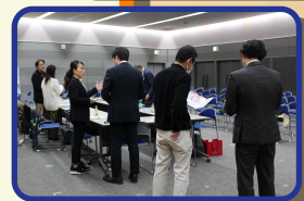
～令和6年度交流会より～