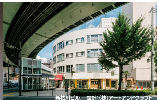
新桜川ビル 設計:(株)アートアンドクラフト