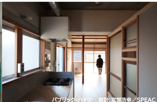
パブリック・ハイツ 設計:宮部浩幸/SPEAC