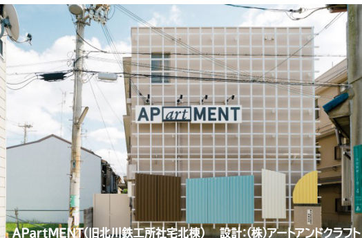
APartMENT(旧北川鉄工所宅北棟) 設計:(株)アートアンドクラフト