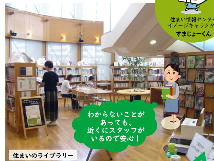
住まいのライブラリー