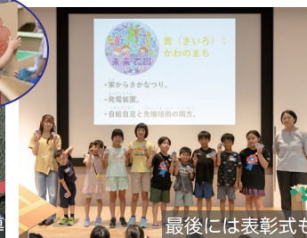
最後には表彰式も

毎年恒例となりました、夏休みの小学生向けワークショップです。 ダンボールを使ってホールいっぱいに大きな“まち”をつくります。 ものづくりの楽しさを一緒に体験しましょう！