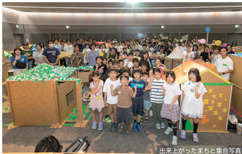
出来上がったまちと集合写真